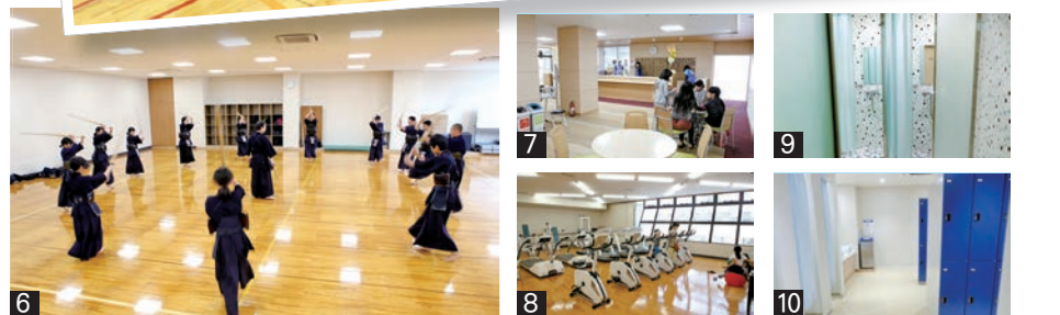
1_記念式典の参加者全員で国体ダンスに挑戦 2_テープカットで完成を祝う関係者ら 3_遠野一輪車クラブのメンバーは、新しくなった体育館でのびのびと演技を披露 4_「BLUE TOKYO」による圧巻のパフォーマンス 5_3年ぶりに再開した市民プール 6_武道ホールで練習に励む遠野剣道スポ少 7_1階フロント周辺 8_トレーニング室 9_10_シャワー室と更衣室も生まれ変わり、快適に利用できるようになりました