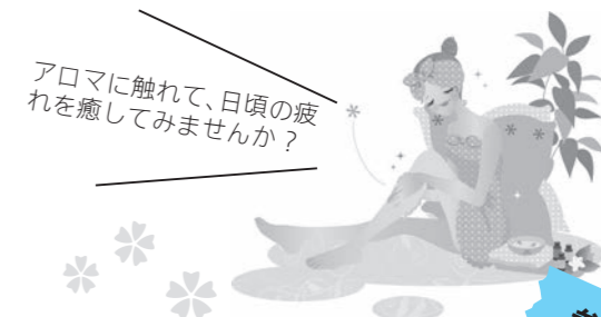
アロマに触れて、日頃の疲れを癒してみませんか？