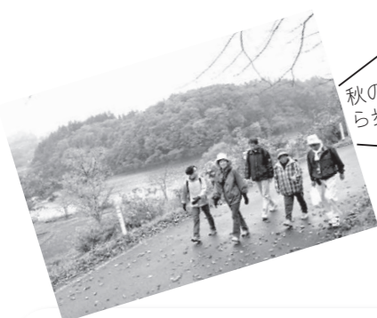
秋の風景を楽しみながら歩いてみませんか？