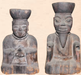
十王像 光明寺(遠野市) 蔵