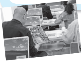
パソコンの仕組みも学べます

■問い合わせ (一財)遠野市教育文化振興財団事務局(☎0198-62-6191)