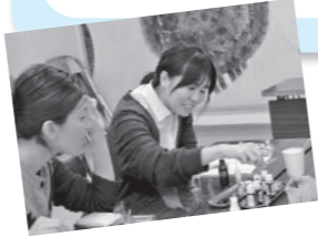
夏に向けて、オリジナルスプレーを作ってみませんか?

■問い合わせ (一財)遠野市教育文化振興財団事務局(☎0198-62-6191)