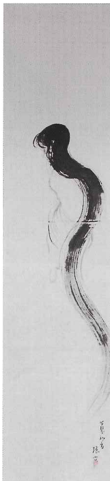
幽霊画 善明寺(遠野市) 蔵 (7月19日~8月4日まで公開)