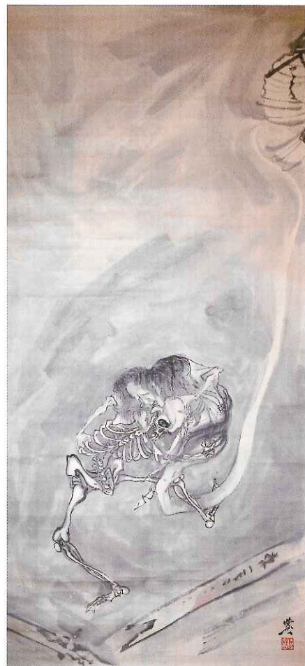
幽霊画 大安寺(奥州市) 蔵