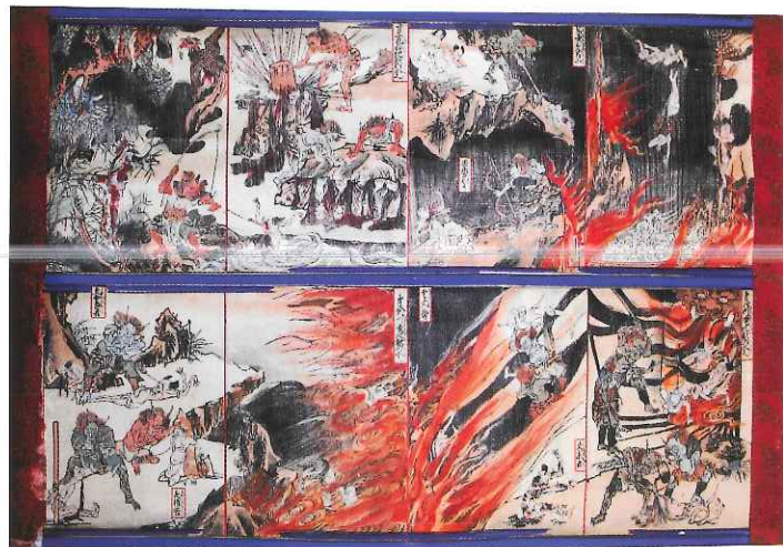
往生要集図絵 萬通寺(遠野市) 蔵