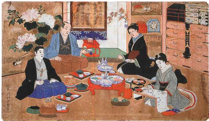
供養絵額 常楽寺(遠野市) 蔵

本展覧会では、岩手県内の寺院に保管されている供養絵額や供養人形、幽霊画、地獄絵など死後の世界を描いた資料を中心に当時の死生観や描かれた歴史的経緯について紹介します。