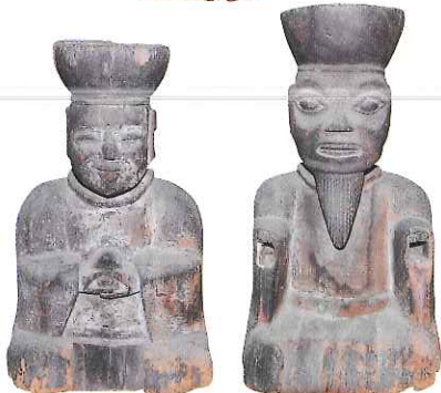
十王像 光明寺(遠野市) 蔵