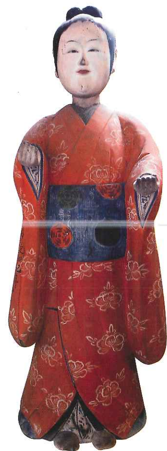
供養人形 西米院(遠野市) 蔵