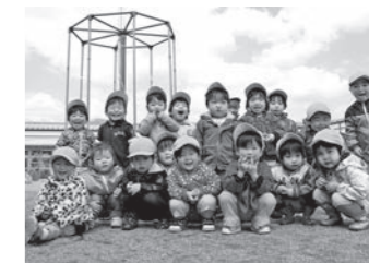
未来を担う子どもたちのためにも計画的なまちづくりを

まちづくり指標とは、市総合計画の到達目標を分かりやすく表したものです。市は、まちづくり指標を毎年度ごとの目標値として定め、まちづくり指標の達成状況から市総合計画の進捗状況を確認しています。