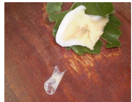
5月7日に発見されたビニール片