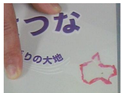
5月9日に発見されたビニール片