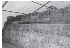
保管されている汚染牧草

現在市内に保管されている牧草は約1,500ト。最長6年かけて処理を完了させる計画ですが、焼却量を増やすことで計画よりも早期の処理完了が見込まれます。引き続き、安全管理に十分な注意を払い、本焼却処理を進めますので、ご理解とご協力をよろしくお願いいたします。