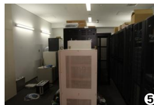
①昔懐かしい消防機材を集めた展示室 ②東日本大震災の後方支援活動を記した生の記録紙が展示 ③市民の安全を守る新通信指令システム ④広域災害に備えヘリポートが常設 ⑤市民の大切な情報が保存されているコンピューターサーバー機器を免震機能を有する防災センターで管理