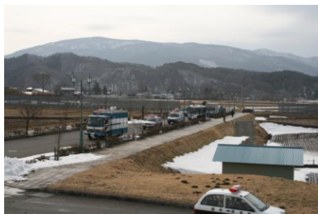
警察東北方面機動隊到着状況