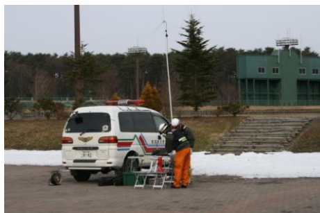
岩手県防災航空隊地上隊の状況