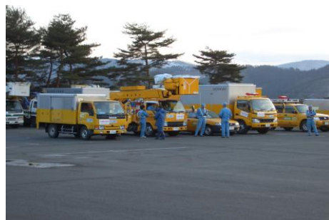
東北電力災害復旧隊集結状況