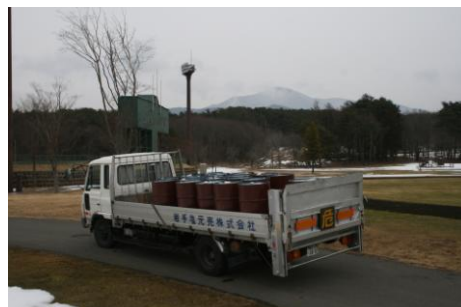
防災航空隊ヘリコプター燃料搬送状況