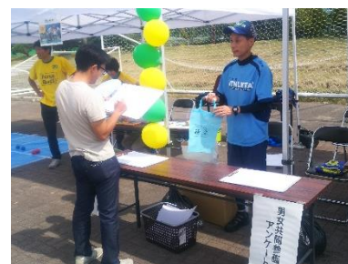
多くの男性にも答えていただきました

9月7日に開催された「遠野わらすっこまつり」において、男女共同参画に関するアンケート調査を実施しました。これは、来年度に策定予定の第4次「と・お・のいきいき参画プラン」に向け、男女共同参画に関する現状について調べたものです。20代から60代まで幅広い年齢層の方々から回答をいただいた結果、遠野市では、多くの項目で国や県の調査結果よりも男女が平等に社会参画しているという結果になりました。