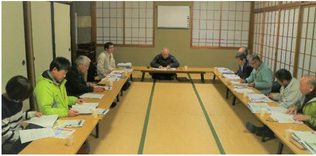
↑ 第2回鱒沢地連協臨時総会での協議の様子。

12月13日(木)に、第2回鱒沢地域づくり連絡協議会臨時総会を開催しました。10月31日(水)に最終回を迎えたワーク