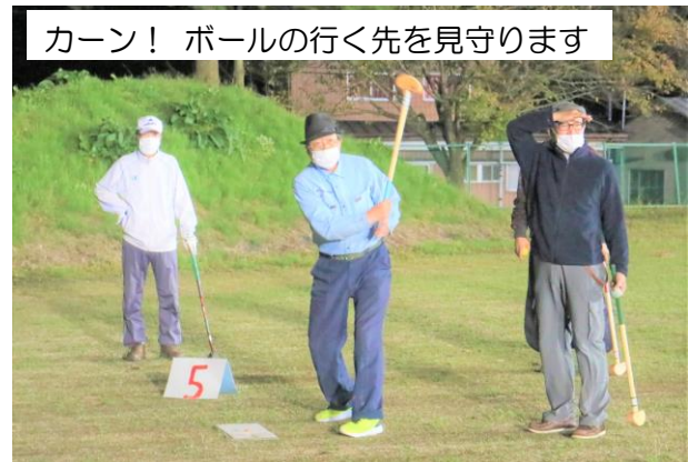
カーン! ボールの行く先を見守ります