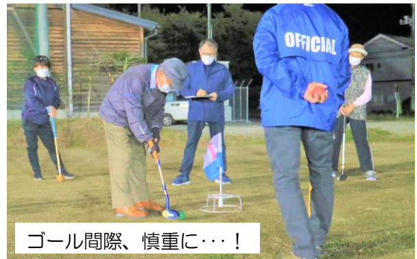
ゴール間際、慎重に…!

参加した町民35名のうち、6名の「ホールインワン」があり、後日ホールインワン賞品をお送りしました。今大会もナイターで行われましたが、16ホールを終える頃には参加者の皆さん体も心も温まったようです。参加者の皆さん、お疲れさまでした。