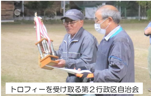
トロフィーを受け取る第2行政区自治会