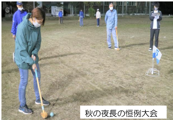
秋の夜長の恒例大会

そして、グラウンド設置準備を下された老人クラブの皆さん、主催した体協役員の皆さん、ありがとうございました。