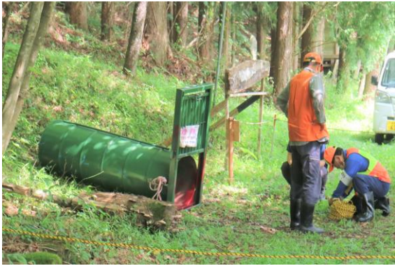
罾を設置する猟友会の皆さん

8月25日、午前と午後、附馬牛小学校付近で熊が目撃され、西側に移動していったという情報がありました。 翌26日に、市農林課立会いのもと、猟友会の方々が、農村公園奥の「のぞみの森」看板付近に罾を設置、様子を見ています。農作業など屋外での活動の際には、十分ご注意ください。 熊目撃情報は、市農林課まで お問い合わせ。電話 62-2111