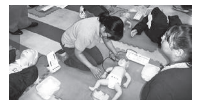
いざというときのために、受講してみませんか?