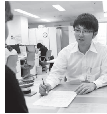
市民の皆さまのために一緒に働いてみませんか?

市は平成26年度の市職員を募集します。一般事務、保健師、栄養士、土木技師、消防職員を採用する予定です。受験申込書は市総務課(とびあ庁舎内)と宮守総合支所にあります。