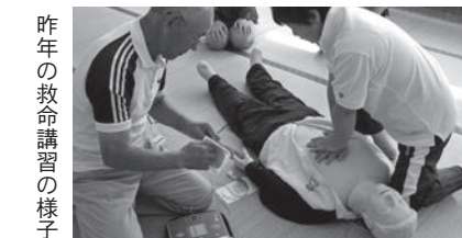
昨年の救命講習の様子