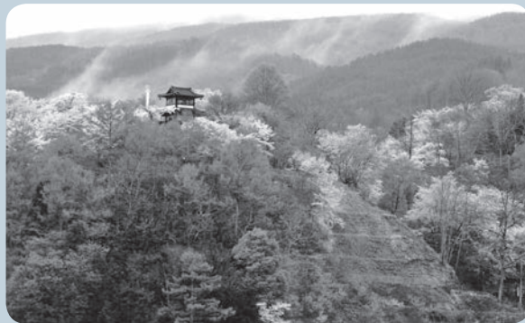
平成24年度最優秀作品「霧と花」