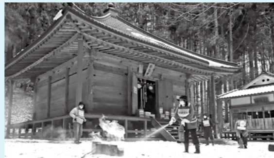
1月28日に宮守町鱒沢で実施した文化財を守る消火訓練。地域の大切な宝を火災から守りましょう