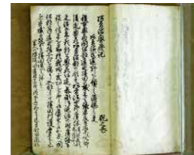
遠野の阿曾沼氏の興亡や事績について、江戸時代に書かれた『阿曾沼興廃記』

本コーナーでは、あまり知られていない遠野の歴史文化をご案内。遠野遺産なども紹介します。