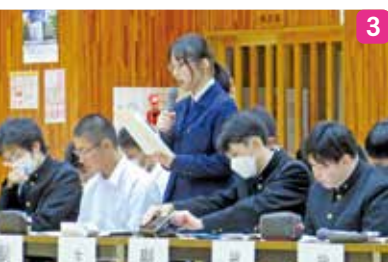
1_生徒会執行部の皆さん 2・3_生徒総会の様子 4_飯能高とオンライン交流を実施。互いの学校について理解を深めた。