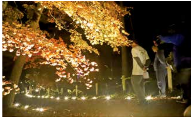
色づき始めた紅葉がライトアップされた