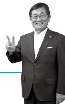
遠野市長 多田一彦