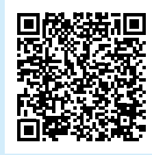
QRコードから 約5分で回答できます

市は、観光マネジメントボード遠野と連携し「遠野の観光に関する市民満足度調査」を実施します。調査内容は、市内観光の魅力や観光客との関わりについてなど。回答は紙またはインターネットからできます。回答の中から抽選で30人に商品がもらえるチャンスも！ 皆様のご協力をお願いします。