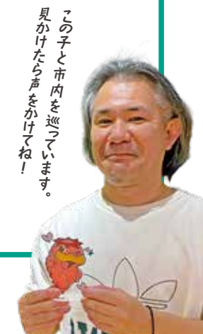
この子と市内を巡っています。見かけたなら声をかけてね!