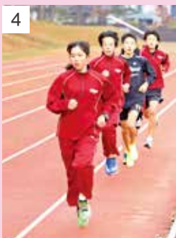
写真/練習の様子(11月23日、花巻市日居城野陸上競技場) 1~3_ウォーミングアップの様子 4・5_休息とダッシュを繰り返すインターバルトレーニングで走力を上げる 6_練習を見守る父母。父母会の結束力の高さも、チームの強さにつながっている