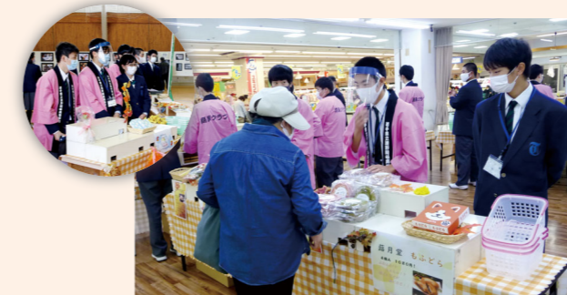
とびあつと緑峰祭での販売は毎年大人気!

2年生が「マーケティング」の授業の一環として実施。全国の特産品を仕入れ、商品販売までを自分たちで行い、起業学習やビジネスマナーなどの基礎を学びます。