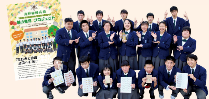
3年生が商品写真・説明・ページ構成を練り上げました

ネットショップを通して農産物などの緑峰高オリジナル商品を全国発信するプロジェクトを初実施。市内民間事業者と連携して商品を「遠野市場」で販売しています。