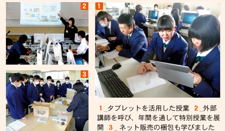
1_ タブレットを活用した授業 2_ 外部講師を呼び、年間を通して特別授業を展開 3_ ネット販売の梱包も学びました

情報処理検定、簿記実務検定、ビジネス文書実務検定、珠算・電卓実務検定、商業経済検定各1～3級 など