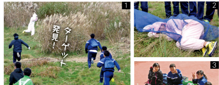
1_ 二手に分かれてうさぎを追いかける 2_ 見事うさぎゲット！ 3_ 終わった後のジンギスカンが実は一番のお楽しみかも☆

管内(遠野・釜石)…20人(大野ゴム工業株式会社、株式会社オサダ岩手事務所) 県内…11人(株式会社アイオー精密、TDK秋田株式会社北上工場) 県外…6人(トヨタ自動車東日本株式会社) 公務員…2人(遠野市消防、盛岡地区広域消防)