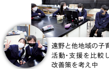
遠野と他地域の子育て活動・支援を比較して改善策を考え中