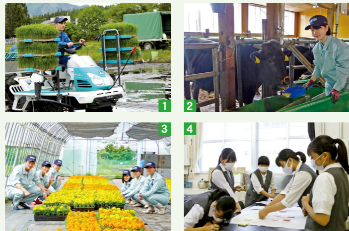
1_ 田植え機を使用した実践授業 2_ 和牛の飼育も本格的に 3_ 自校の農場で花を栽培 4_ プラスチックごみ問題の解決策を考え中

危険物取扱者試験丙種、日本農業技術検定3級、家庭科技術検定 食物調理1～4級、家庭科技術検定 被服製作1～4級、ビジネス文書実務検定3級、情報処理検定3級、 など