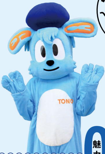
遠野高校マスコット かじょうくん

野高校は、明治34年に旧制中学校「岩手県立遠野中学校」として誕生しました。今年で創立120周年を迎える県内で3番目に歴史のある学校です。「修徳尚武」を校訓に、文武両道を貫いています。