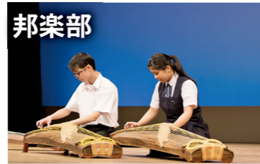
市民センターで発表会♪