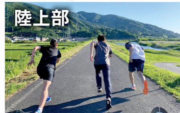
晴天の下でダッシュ！！