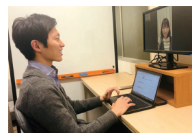
メッセージチャットやビデオ通話で直接相談できます

「小児科・産婦人科オンライン」は、スマートフォンアプリ「LINE」で医師・助産師と医療相談ができるサービス。本市在住の人は専用の「合言葉」を使って登録すると無料で利用できます。「合言葉」は元気わらすっこセンターまたは健康福祉の里で確認ください。