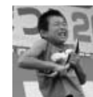
ウナギのつかみ取りに挑戦する児童(昨年度より)

魚のつかみ取りや早食い競争など、楽しいイベントがいっぱい。柏木平で夏の思い出づくりをしてみませんか。