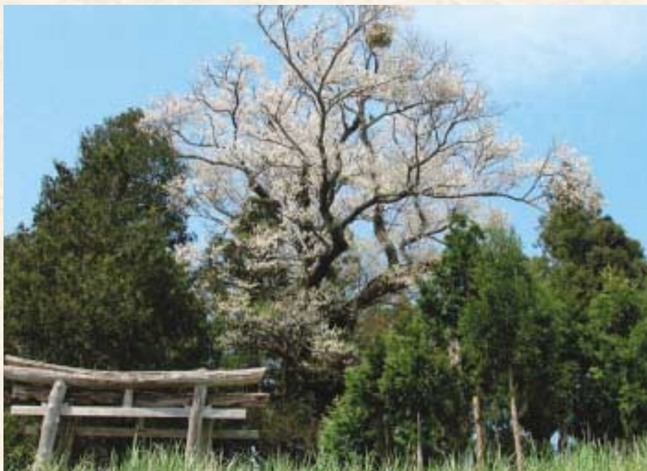
市指定天然記念物 所在地 宮守町上宮守 所有者 菊池祐幸