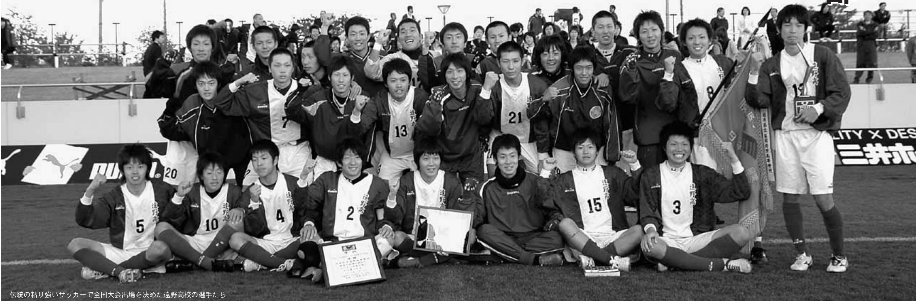
伝統の粘り強いサッカーで全国大会出場を決めた遠野高校の選手たち