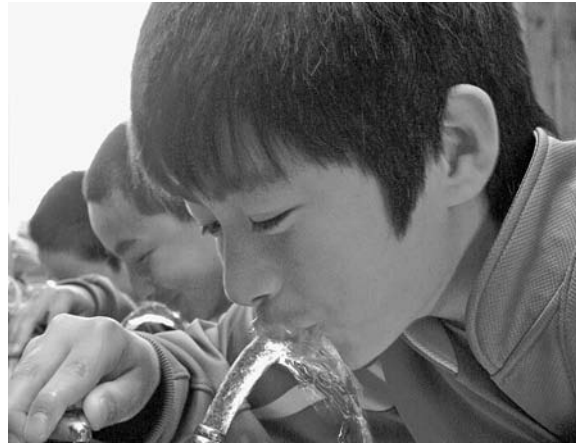
6月1日〜7日は水道週間 「水道に 寄せる信頼 飲む安心」

昨年度の検査結果では、水道水として使用するために必要な「健康に関する項目(30項目)」、「水道水が有すべき性状に関する項目(20項目)」、「独自検査項目(3項目)」すべてが基準値に合格し、安全な水であることが確認されました。これからも、適正な管理に努めながら、皆さんに安全でおいしい水を提供します。 ※注1…腸内で増殖して下痢や腹痛、嘔吐などを引き起こす病原性原虫 注2…発症すると下痢や腹痛などを引き起こす感染性原虫 注3…酸素のない条件下で生育する耐性の強い細菌