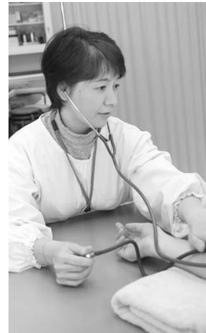
検診は自分の健康状態を知るための通信簿。毎年必ず受診しましょう

検診は、自分自身の健康状態を知るための、いわば通信簿。特に「がん」は、日本人の死亡原因で一番多い病気です。初期のがんは自覚症状が現れにくく、気付いたときにはがんが進行し、完治が難しくなります。しかし検診でがんを早期に発見し、進行する前に治療ができれば、高い確率で治癒するといわれます。 平成20年度から、40歳以上の人を対象に特定健診が義務付けられています。特定健診とは、最近話題のメタボリックシンドローム(内臓脂肪症候群)を発見し、生活習慣病を予防することを目的に行われる健診のことです。下図で自己チェックをしてみましよう。40歳から74歳までの人が対象で、それぞれ加入している医療保険者が実施します。国民健康保険加入者は、市で行う集団健診を受診してください。 毎年必ず受診し、自分の体を正しく知りましょう。