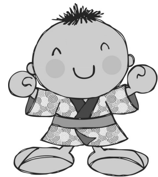
わらっぺこブラン イメージキャラクター「わらっぺ」

市は、仕事などを抱える保護者に代わり、病気や回復期にある子どもを保育するサービスを開始しました。 県立遠野病院とも連携し、安心・安全の環境を整えています。