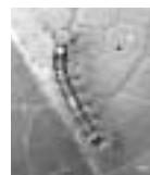
幼虫時のカシワマイマイ

カシワマイマイは森林や果樹の葉を食べる害虫で、昨年、県内で大量発生しました。昨年産み付けられた卵が幼虫にかえる時季です。今年も大量発生が懸念されることから、自宅の壁や庭木で卵や幼虫を見つけたら直接手で触れないよう取り除き、燃えるごみに出してください。