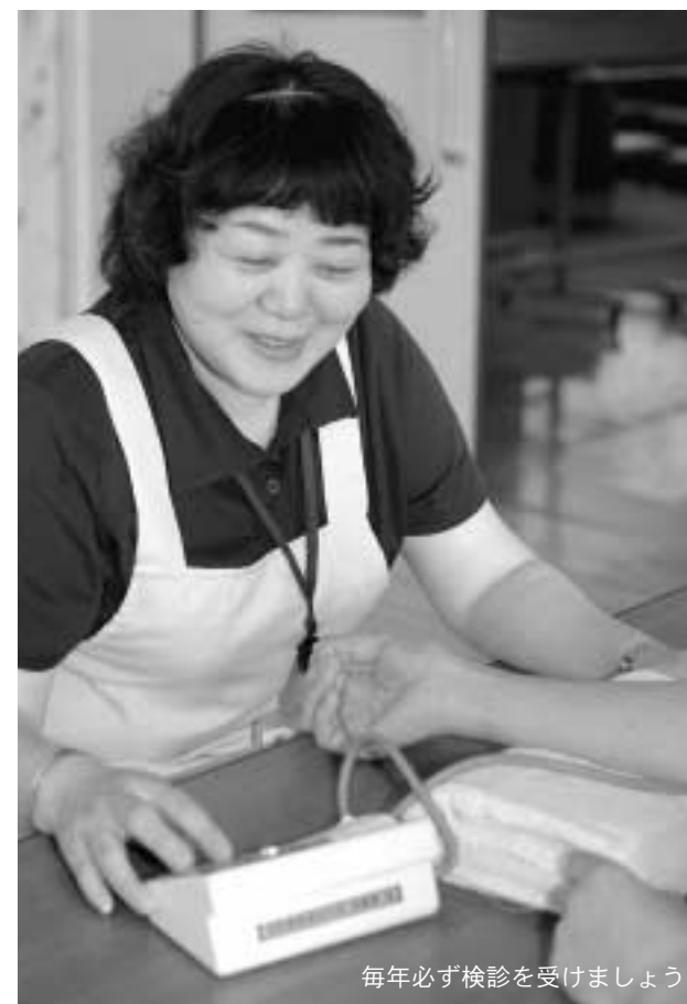
毎年必ず検診を受けましょう

た、受診後「要精密検査」と判定された場合は、すぐに医療機関を受診してください。毎年メタボ健診を受け生活習慣の改善に心掛けよう 昨年度から四十歳以上の人を対象に、特定健診が義務付